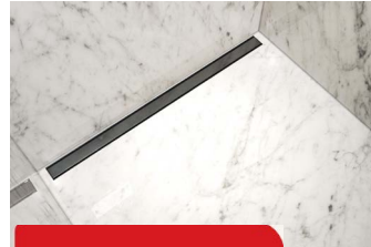
TEGELS OP VLOER →

Wil je een waterdichte ondergrond voor het betegelen van de wand of de vloer in een natte ruimte? Kies jouw specifiek bouwsysteem met iSOX bouwplaten, afdichtingsdoeken of -matten al naargelang de toepassing en ondergrond.